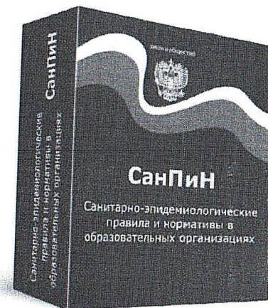
Санитарно-эпидемиологические правила и нормативы СанПиН 2.4.2.2821-10 утратили свою силу с 1 января 2021 года

Обращаем внимание на то, что при любой температуре образовательная организация обязана организовать учебный процесс для любого количества обучающихся, в частности правовых оснований отмены учебных занятий из-за сильных морозов в настоящее время не имеется.